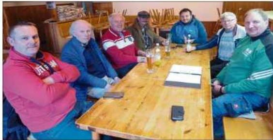
Nur wenige fanden sich am vergangenen Samstag zur Jahresversammlung des Fanclubs „Harter Kern“ im Tennisheim ein.

Seit Gründung des Fanclubs sei der Nachwuchs finanziell und der Verein ideell unterstützt worden. Der Fanclub sei im wahrsten Sinne