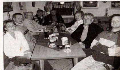
Unterstützer des FC Furth im Wald und dessen Jugend: Mitglieder des Fanclubs „Harter Kern“ während der Jahreshauptversammlung.