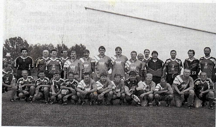
Die jungen „Wilden“ vom Fanclub setzten sich knapp mit 2:1 gegen die erfahrenen AH-Spieler durch.