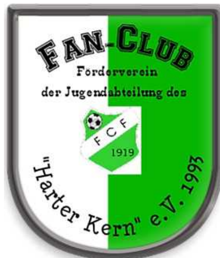
Das neue Vereinswappen des Fan-Club „Harter Kern“ e.V. 1993 entworfen durch Markus Binsner (Dez 2017)

Der neue Vorsitzende des Fan-Club sortierte erst einmal die alten, übergebenen Unterlagen des Vereins. Alle wichtigen Unterlagen (Protokolle, Beschlüsse usw.) wurden durch ihn digitalisiert und auf Datenträgern abgespeichert. Die gesamten Mitgliedsdaten wurden als Datensätze, mittels einer Vereinssoftware, erfasst und abgespeichert. Die Anschriften der Vereinsangehörigen wurden überprüft und aktualisiert. Für das Auftreten des Vereins in der Öffentlichkeit ist zudem ein neues Vereinswappen entworfen worden und wird von der Vorstandschaft seit Dez 2017 verwendet.