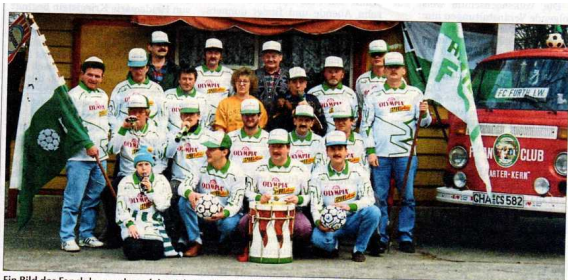
Ein Bild des Fanclubs aus der erfolgreichsten Zeit des Further Fußballclubs vor dem OGV-Waldhäusl, das als Vereinsheim diente.